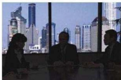
Telecamera normale con BLC off