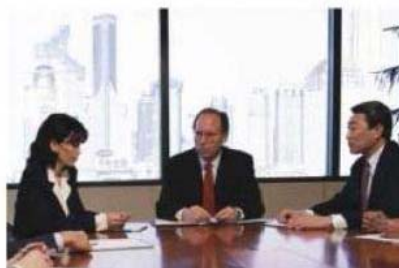
Telecamera normale con BLC on