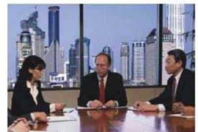
Telecamera con funzione WDR